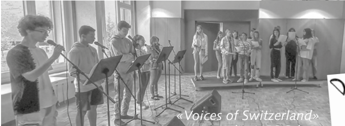
«Voices of Switzerland» an der MPS Schwyz