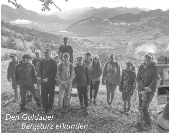
Den Goldauer Bergsturz erkunden