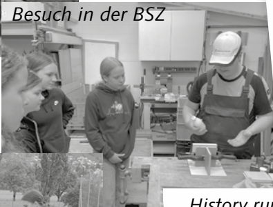
Besuch in der BSZ