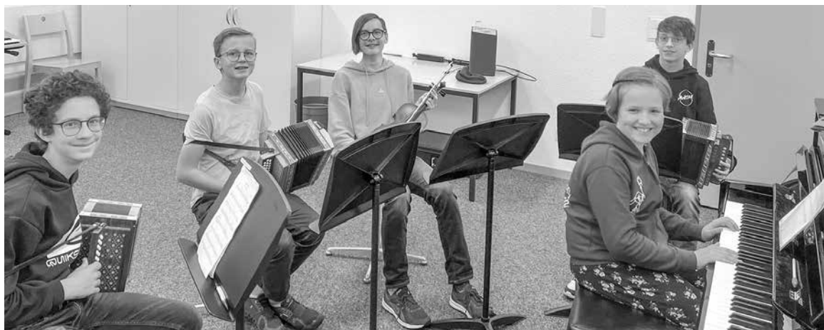
Die Mitglieder des Volksmusikensembles der Musikschule Schwyz beim Proben.

Auf der Homepage der Musikschule sind sämtliche Veranstaltungen für das Schuljahr 2022/2023 aufgeschaltet. Benützen Sie die Gelegenheit, die vielfältigen Auftritte der Musikschule zu besuchen. Alle Musizierenden freuen sich auf Ihr Kommen. Oder werden Sie selber aktiv und lernen ein Instrument an der Musikschule Schwyz!