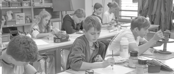
Die Welt der Kunst entdecken