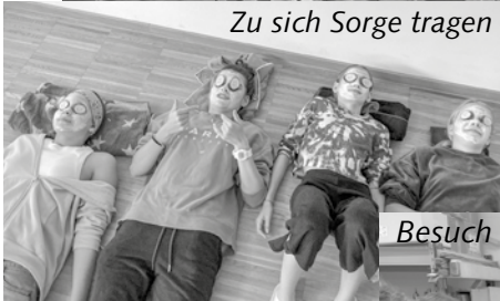
Zu sich Sorge tragen