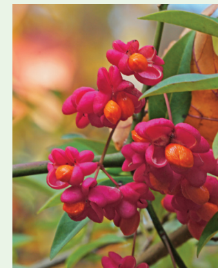
Pfaffenhütchen Euonymus europaeus