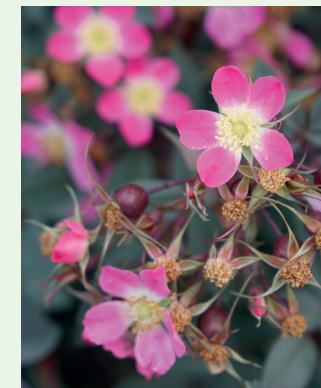
Bereifte Rose Rosa glauca