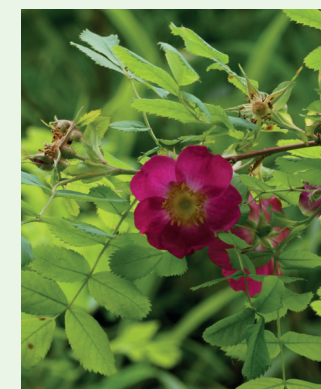
Alpen-Hagrose Rosa pendulina